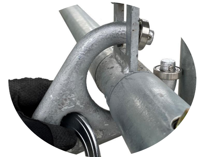
各スパンに出入口